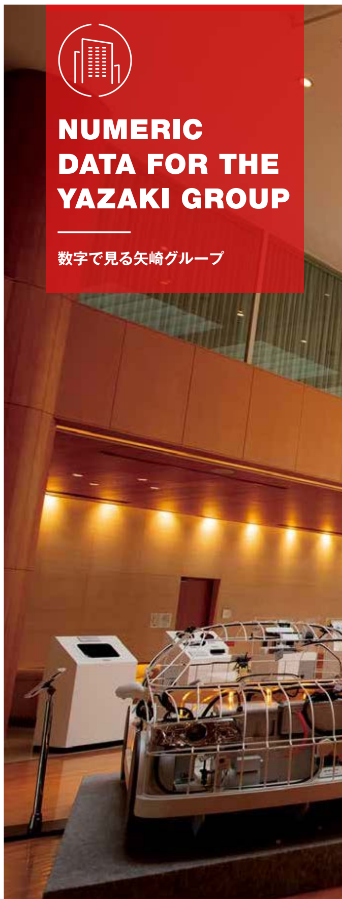
ワールドヘッドクォーターズのロビー