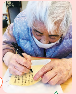
絵馬に願いを込めて