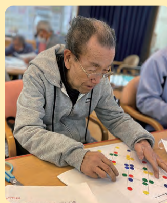
取り組む姿勢は真剣そのもの！