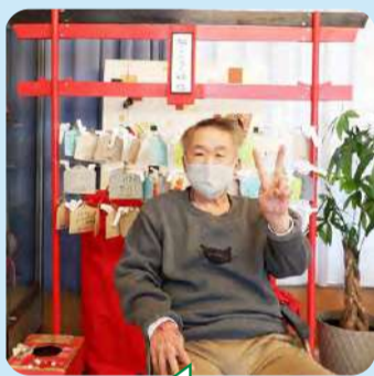
ピースサインも決まっています！