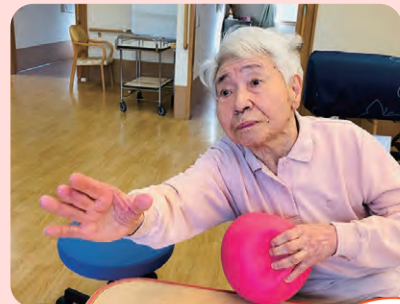
1.2! ボール体操 1.2!