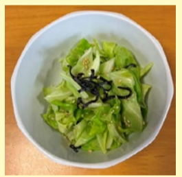
2. ごま油いりごま塩こんぶを混ぜる