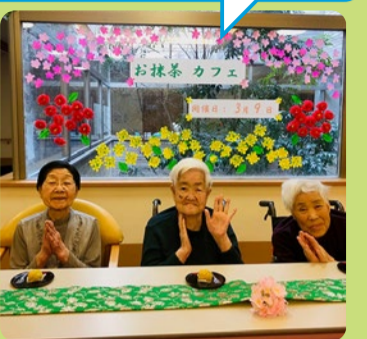
♪菜の花島に、入日薄れ〜♪