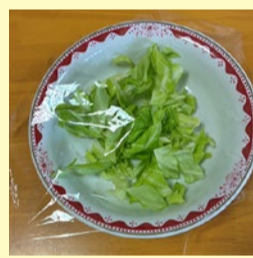
1. ラップをふんわりかけて600wで40秒加熱する