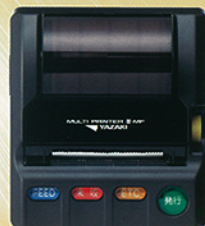
新計量法印字は マルチプリンタIV(別売)で行えます。

システム・タクシー用タコグラフ機能 内蔵により情報のデータ化を実現。 業務効率アップで経費を削減。