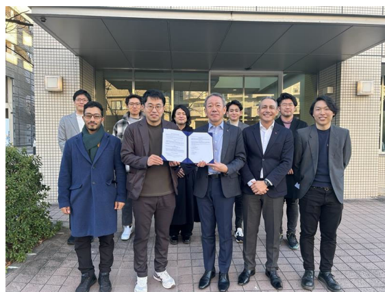
矢崎ノースアメリカ、TOWINGメンバー